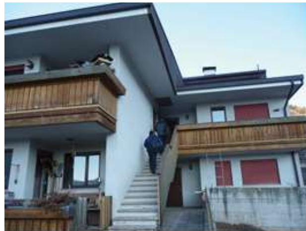
Fig. 1, 2 - vedute esterne edifici