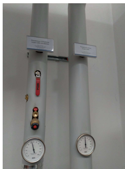
Fig 4 - condotti di mandata e ricircolo acqua calda sanitaria